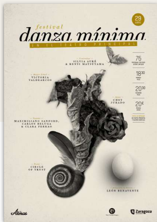
3ª EDICIÓN: 2018 TEATRO PRINCIPAL ZARAGOZA