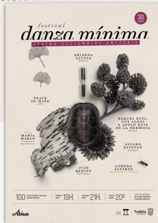
5ª EDICIÓN: 2020 CASTEL RUIZ TUDELA