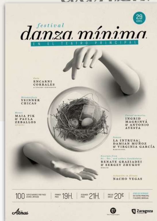
4ª EDICIÓN: 2019 TEATRO PRINCIPAL ZARAGOZA