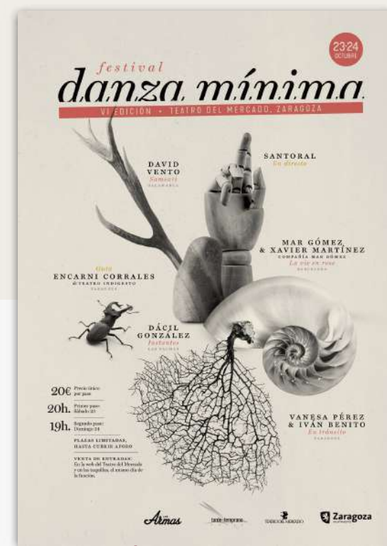
6ª EDICIÓN: 2020 TEATRO DEL MERCADO ZARAGOZA